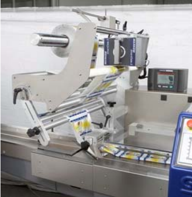
Système de marquage