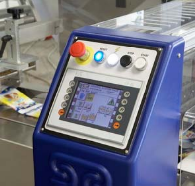
Tableau de commande avec écran tactile couleur