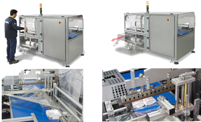
Bande d'alimentation et conformateur à hauteur réglable