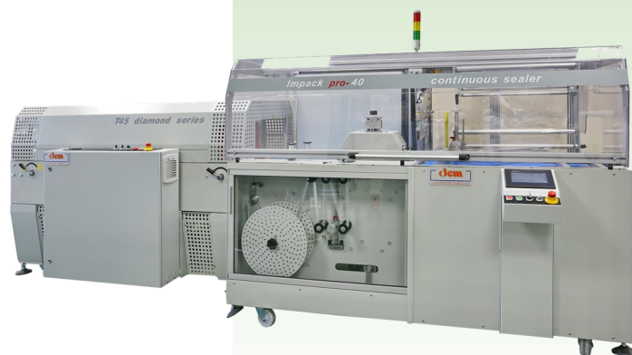
IMPACK 40 PRO associée à un tunnel de rétraction T45

Les modèles IMPACK sont des machines automatiques horizontales de mise sous film à soudure longitudinale en continu avec gestion du transfert des produits par 2 tapis. Ces machines peuvent être associées à un tunnel de rétraction et sont conçues pour des productions à haute cadence (jusqu'à 60 coups / minute selon format et film).